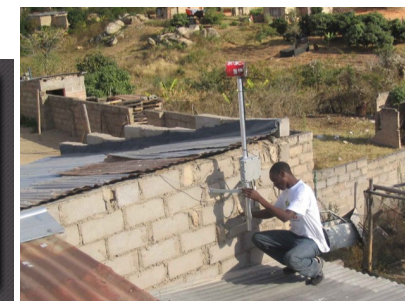
Installation d'une antenne en Afrique du Sud dans le cadre de l'institut Meraka